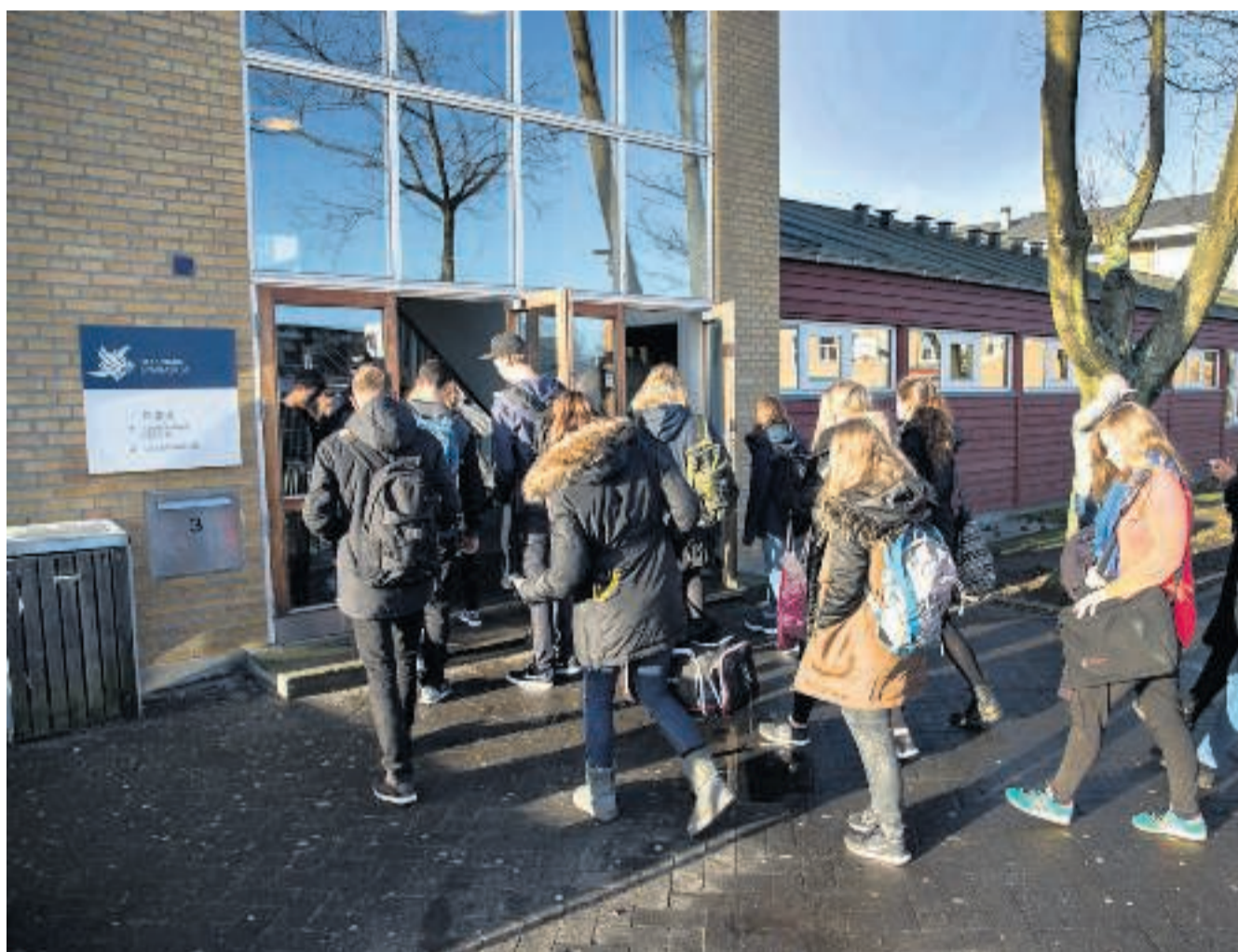
Eleverne på Helsingør Gymnasium får højere karakterer til afgangseksamener, hvis man ser på gennemsnittet.

Også Helsingør Gymnasium har skåret ned på karaktererne og er gået over til formativ feedback.