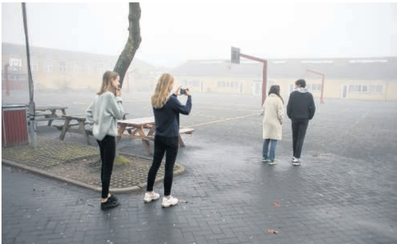
Elever fra otte 1.g klasser var i går i gang med at optage film, hvor hele gymnasiet blev brugt som filmkulisse.

Forløbet med at producere lommefilmene strækker sig over en enkelt skoledag. Det er eleverne selv, der optager og redigerer filmene, fortæller Kasper B. Olesen