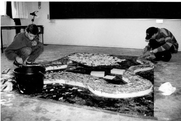
Nu gik eleverne i gang med at lave Lin Utzon-portaler til C-fløjen