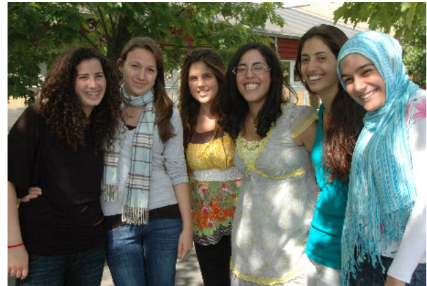
Besøget af israelere medførte hvert år spændende samtaler - også med elever med muslimsk baggrund - her fra besøget i 2008