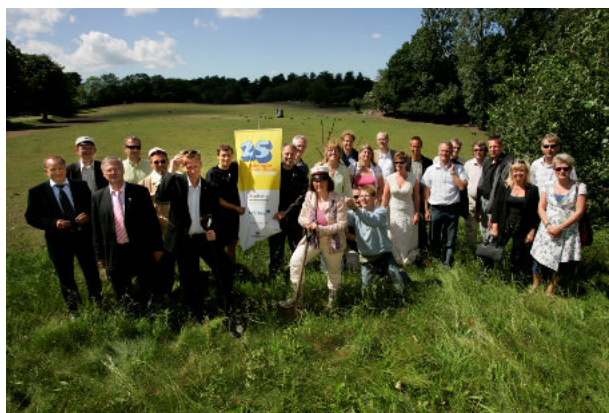
De første HG-studenter fra 1981 håbede med dette symbolske spadestik omsider efter 28 år at kunne sikre gymnasiet nye bygninger

Men inden man kommer så langt, er det måske værd at se på Helsingør Gymnasium, som bor i lejede bygninger. Det vil være en nærliggende tanke at benytte lejligheden til at få et mere moderne gymnasium til erstatning for det nuværende."