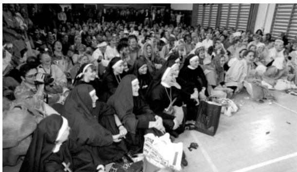
Sidste skoledag har altid været præget af muntre udklædninger - her er det årgang 1993, der spændt venter på eksamensfagene