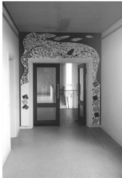
Nu skinnede C-fløjen også med Lin Utzon-kunst