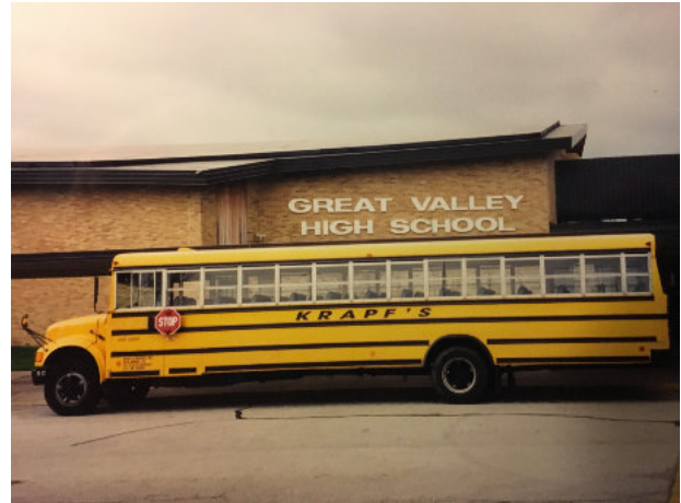
USA-udvekslingen 1997/98 - Great Valleys skolebus har alle år bragt vore elever ind til Philadelphia, til New York og Washington DC