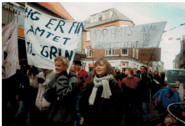
Fra demonstrationen i Helsingør