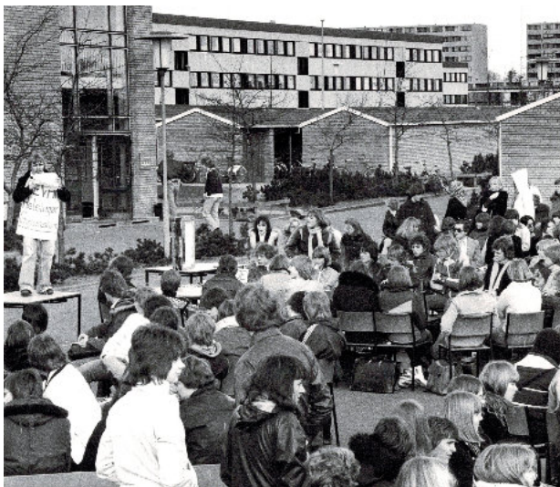
Demonstration i april 1978 (!) for gymnasiets bevarelse

Når der var tale om, at bygge et nyt gymnasium "udenfor byen", hang det også sammen med en administrativ ændring: Den 1. april 1973 var Helsingør Gymnasium som følge af en ny lov overgået fra Helsingør Kommune til Frederiksborg Amt, og efter en større diskussion af, hvor de nye bygninger skulle placeres – Gurrevej i selve Helsingør eller Hovvej i Espergærde – traf Amtsrådet selv en beslutning: Helsingør Gymnasium skulle flytte til Espergærde.