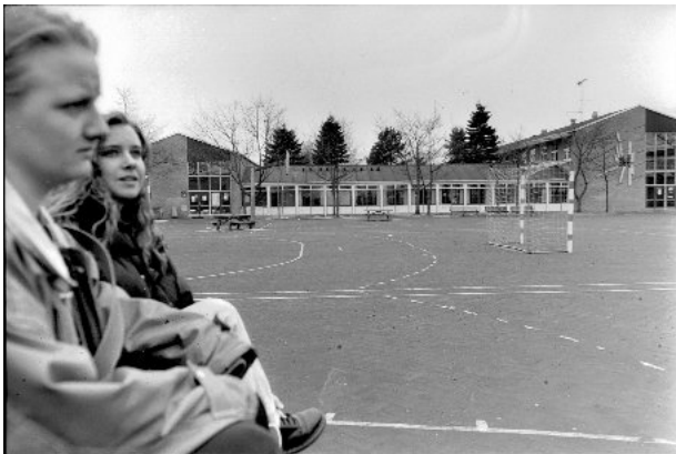
Det gamle gymnasiums bygninger på Rønnebær Allé skulle nu de næste par år huse det nye gymnasium

Det er altså værd at notere sig, at "opholdet" i Helsingør Kommunes bygninger på Rønnebær Allé var tænkt som en midlertidig løsning – husk også