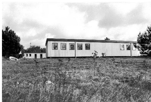
Nødgymnasiets bygninger ved Helsingør Teknikum 29.10.1978