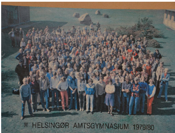
Elever og lærere 1979/80 i anlægget mellem de to fløje i de "nye" lokaler

af sommerferien flyttede det gamle gymnasium ud og det nye gymnasium ind.