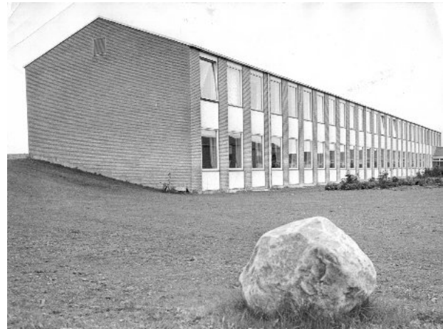
"A-fløjen" eller "Science-fløjen" på Rønnebær Allé