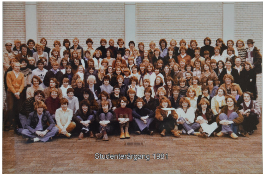
Elever og lærere på Frederiksborg Amtsgymnasium, Helsingør Nødgymnasium

Og hvad så med navnene? Amtsrådet løste problemet på den måde, at det gamle Helsingør Gymnasium nu fik navnet "Espergærde Amtsgymnasium" – og det nye "FAGH" fik navnet Helsingør Amtsgymnasium.