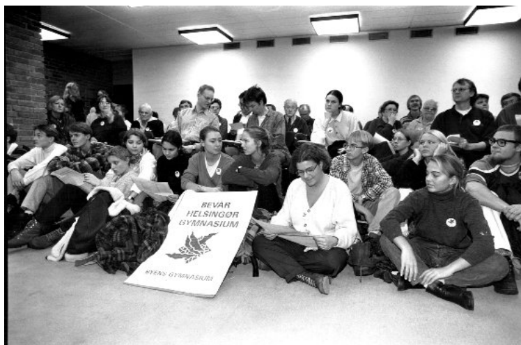
Elever og lærere ved Amtsrådsmødet november 1994

"Den iværksatte administrative høring af de berørte parter stoppes, og forslaget om en sammenlægning af Helsingør og Espergærde Gymnasium i Espergærde Gymnasiums bygninger, flytning af HF Øst og Voksenuddannelsescentret til Helsingør Gymnasiums bygninger og placering af en del af Social- og Sundhedsuddannelserne på Espergærde Skole bortfalder"