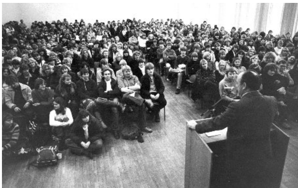
Statsminister Anker Jørgensen på besøg på Helsingør Amtsgymnasium 13. januar 1981