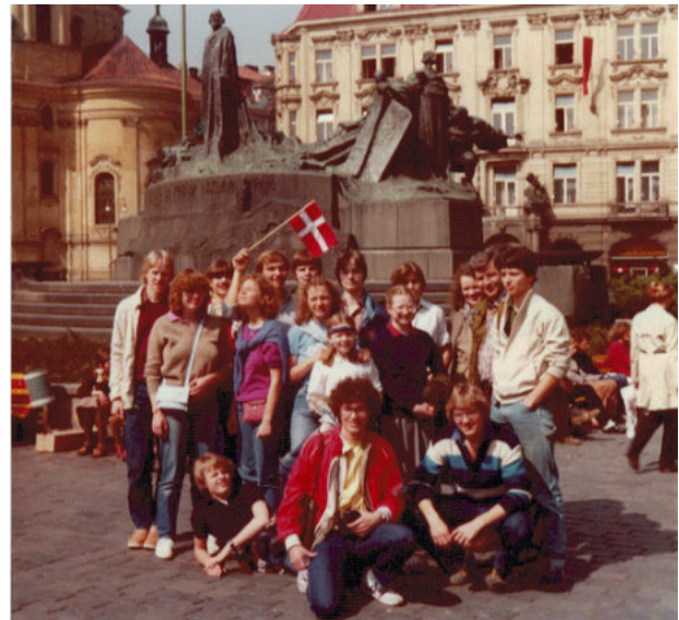
2.z i Prag i påsken 1981

Det var også det efterår, en studiekreds omkring Israel og Mellemøsten blev oprettet. Mange elever ønskede at lære mere om situationen her og nu, og Otto Rühl, der havde været i Israel i 1977, mødtes ti gange i efteråret og ti gange i foråret med en gruppe elever – som så enedes om at drage til Israel i sommerferien 1982. Disse ture fortsatte op til 1990'erne, hvor de omsider lykkedes at få et ven-skabsgymnasium dernede, og turene blev ændret til udvekslinger.