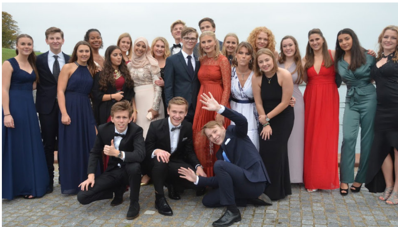
Fra 40-års-fødselsdagsfesten – her 3.x på vej til gallamiddag på gymnasiet

Hun var uddannet fysiker, havde også undervist og forsket i Singapore og havde 2001-04 været forsk-