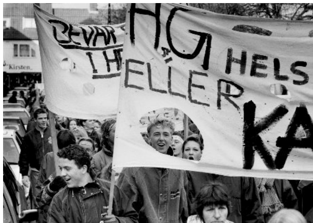
Demonstration for at bevare Helsingør Gymnasium i november 1994