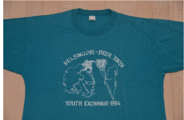
I sommeren 1994 kom der for første gang israelske elever fra Beer Tuvia High School på besøg på Helsingør Gymnasium - hver udveksling sin T-shirt - her fra den første i 1994/95