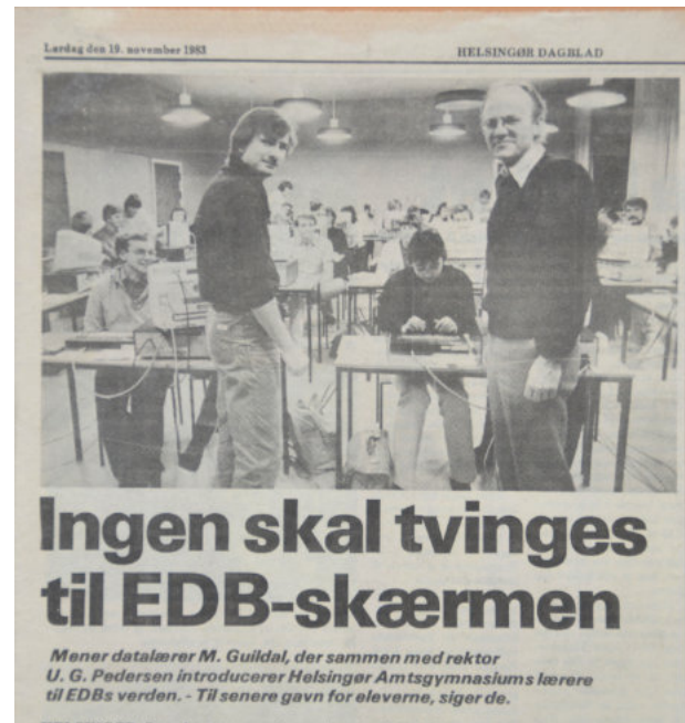
Starten på den nye fagverden – EDB klip fra Helsingør Dagblad november 1983

så høj grad også for sproglige". Og han håbede, at med 30-timers-kurset ville eleverne på HAG nu få en indsigt i, hvordan datamater faktisk fungerer og dermed i langt højere grad blive i stand til at deltage i den teknologidebat, der foregik i de år.